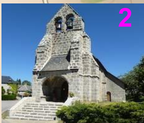
Église St Sylvain 12 ème siècle