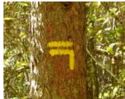
Préparez-vous à tourner à gauche