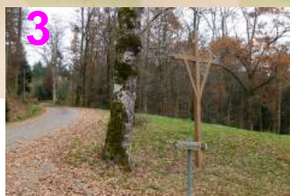
Croix de Froidefond