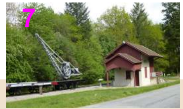
La gare du Tacot