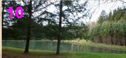
L'étang à Chiragol