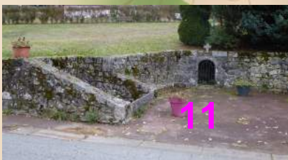
Lavoir et fontaine dans le bourg