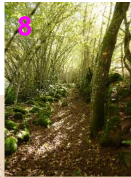
Chemin creux bordé de murets