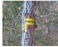
Préparez-vous à tourner à droite