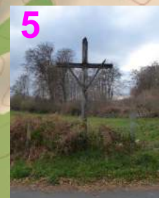
La croix des Brejades