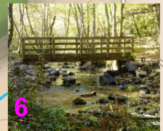
La passerelle sur l'Artaude au Pont d'Atoir