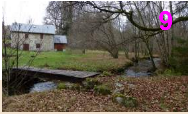
L'Artaude au moulin de Chaumerliac